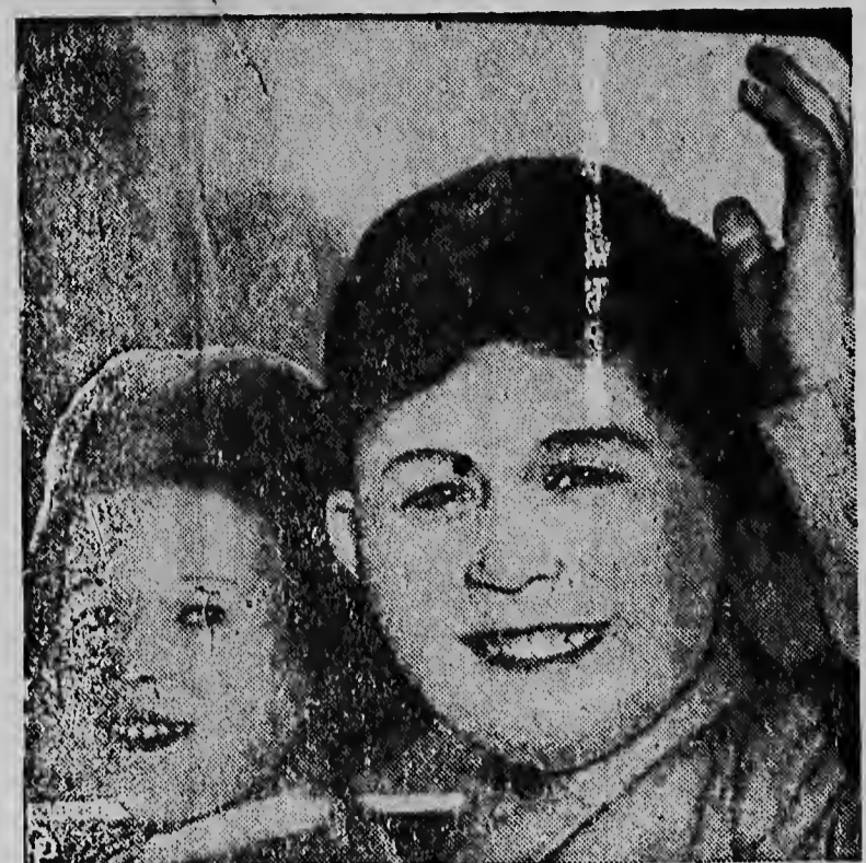
PRINCE CHARLES and Princess Anne wave to crowds on leaving Buckingham Palace, London, to sail for Africa, where they will join their parents, Queen Elizabeth II and the Duke of Edinburgh. The reunion will take place at Tobruk, on the North African coast, made famous during World War II. The children have not seen their parents since they left on a Commonwealth tour.

afgedaan en dit vraagstuk dient op deze conferentie te worden afgehandeld”, aldus Tsjoë. Na het Koreaanse bestand, verklaarde spreker, heeft de Amerikaanse regering de „zogenaamde overeenkomst tot wederkerige verdediging“ met Zuid-Korea aangevaand, welke haar het recht geeft troepen daar te houden. Dit verdrag was „openlijk in strijd met de bestandsovereenkomst“. Minister Tsjoë sprak toen de „volledige instemming“ van de Chinese volksrepubliek uit met de voorstellen van generaal Nam Il voor de hereniging van Korea en het houden van vrije verkiezingen. Vervolgens verweet Tsjoë, aldus de Chinese zeggman, de Verenigde Staten van het „binnenvallen van het Chinese territorium Taiwan (Formosa)“ tegelijk met het ontketenen van de Koreaanse oorlog. Formosa is gemaakt tot een subversieve basis voor het voeren van agressieve bedrijvigheid tegen het Chinese vasteland. De bezetting van Chi-nees gebied door wie dan ook zal niet worden geduld, aldus Tsjoë. Het Japanse militarisme is sinds lang een probleem geweest voor de Aziatische landen. Nu wordt het in versneld tempo nieuw leven ingeblazen en bedreigt het noodwendig de vrede in het Verre Oosten en Azië.